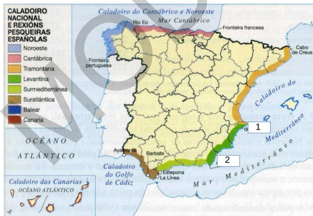
Figura 3 (Editorial Anaya)

Atendiendo a la figura 3: a) Identifique el tipo de documento y la información presentada ( 1 punto ) indique el nombre de 2 provincias de la región Surmediterránea y los 2 cabos -numerados- que limitan la región levantina ( 1 punto ); c) Explique las características de los caladeros nacionales ( 1,5 puntos ); d) Indique las posibles alternativas a los problemas que presenta la pesca ( 1,5 puntos ).