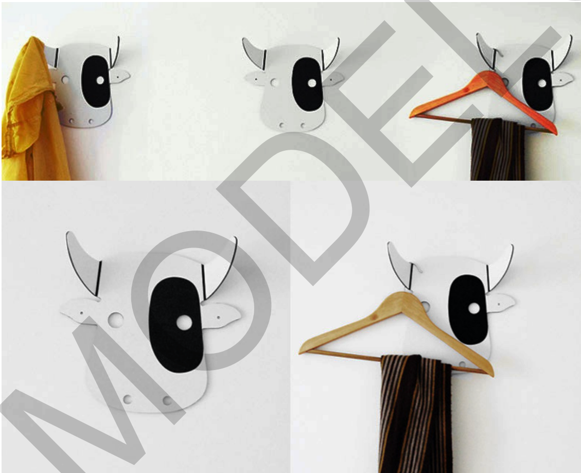
DESEÑO: "Percherona" de Oitenta

4.2. Partindo da análise anterior, faga unha proposta de deseño para outro percheiro infantil co mesmo material / Partiendo del análisis anterior, haga una propuesta de diseño para otro perchero infantil del mismo material. (7 puntos: bosquejos/bocetos 2, proposta/propuesta final 3, presentación 2)